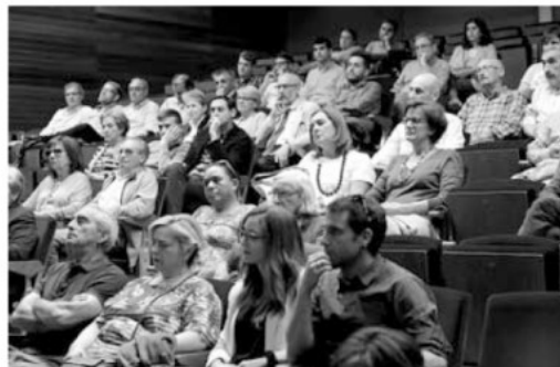
Algunos de los asistentes a la presentación del libro.